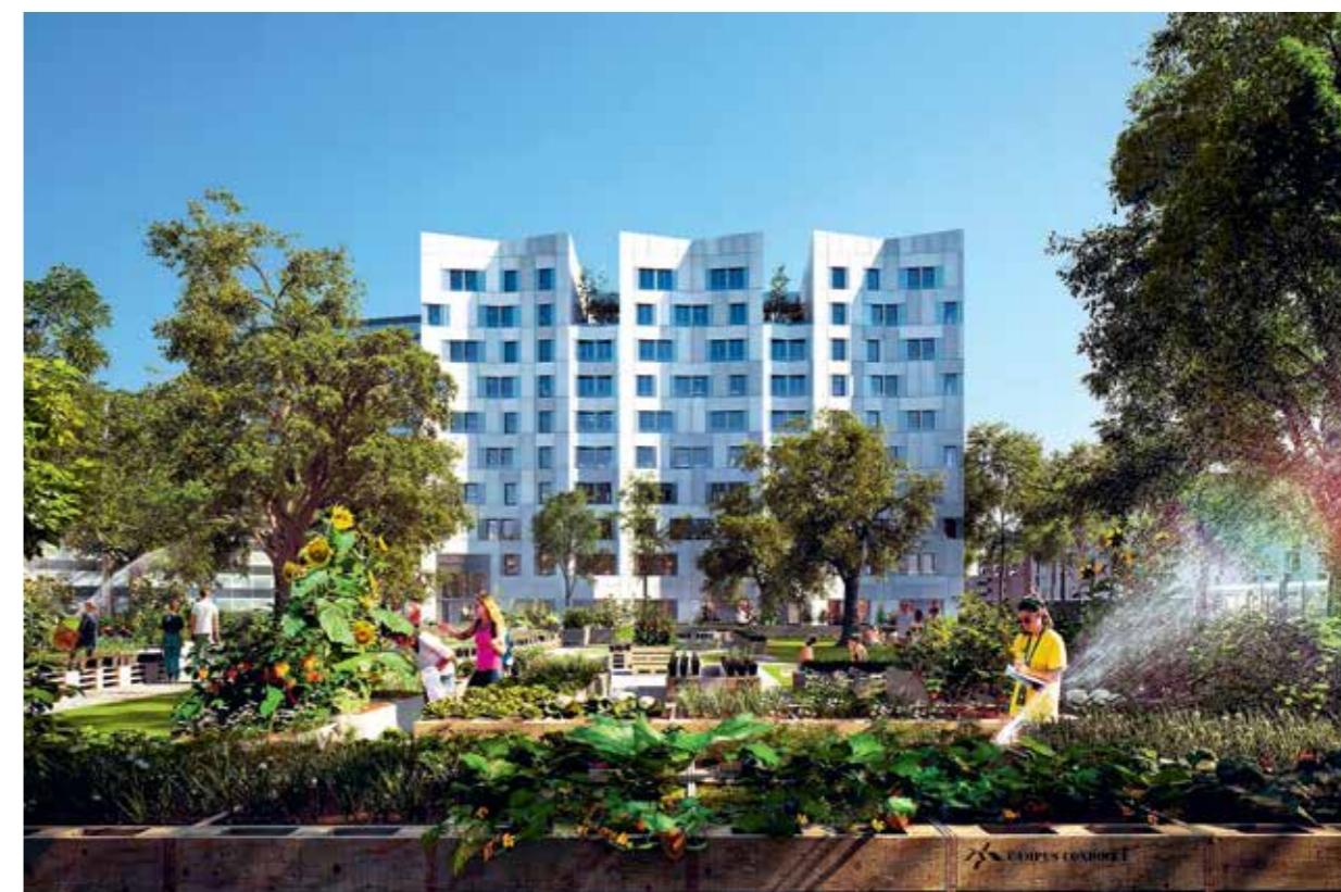
Vue de la maison des chercheurs depuis le jardin potager.