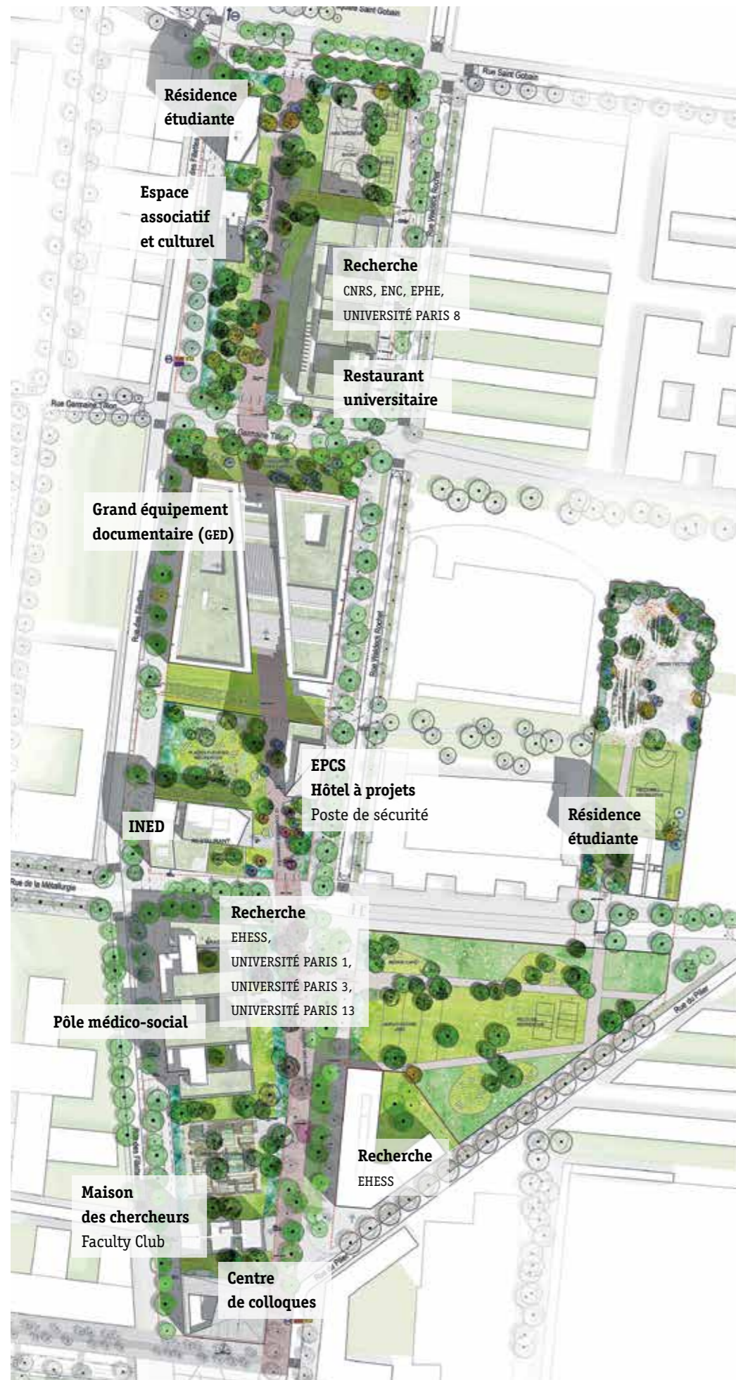
Plan masse des bâtiments du Campus Condorcet à Aubervilliers. © Agence TER, Campus Condorcet 2015

Condorcet et de ses assistants. Conformément au règlement de la consultation, les offres ont été jugées sur des critères fonctionnels, techniques, juridiques et financiers. L'analyse a été menée en concertation avec l'ensemble des chefs des établissements fondateurs, avec les collectivités territoriales (ville de Paris, Région Île-de-France, agglomération de Plaine Commune, ville d'Aubervilliers), ainsi qu'avec un panel d'usagers du Campus défini par les fondateurs. Les commissions correspondantes s'étaient déjà réunies afin d'analyser les offres reçues au cours des deux tours précédents. Au mois de décembre, à l'issue de cette analyse, le groupement formé par GTM, 3i Infrastructures et Cofely Finance et Investissement a été informé qu'il était pressenti pour être le titulaire du contrat et que l'Établissement public souhaitait entamer avec lui le processus de mise au point du contrat.