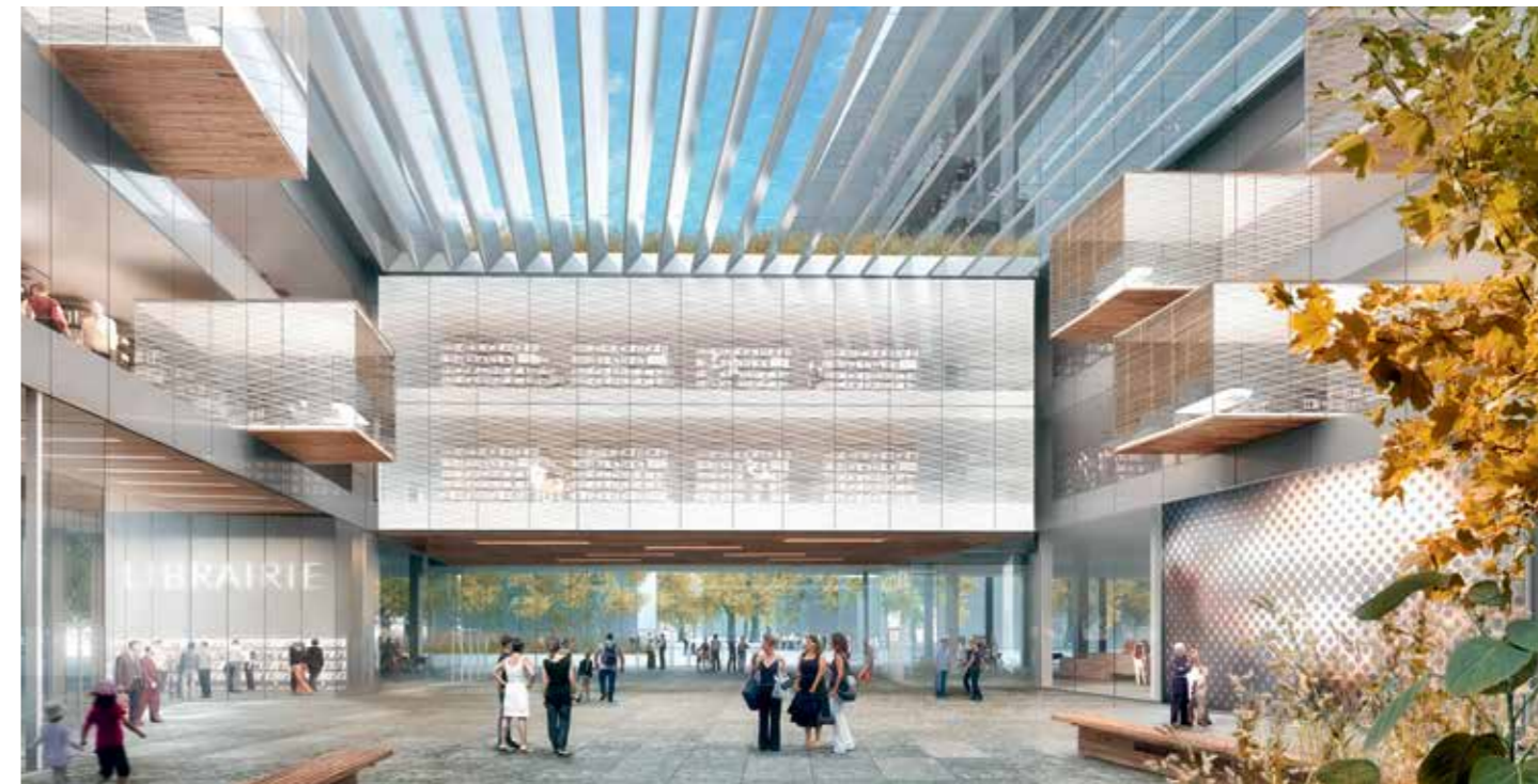
Perspective du Forum de la Bibliothèque. © Elisabeth de Porzamparc, Conseil régional Île de France 2014