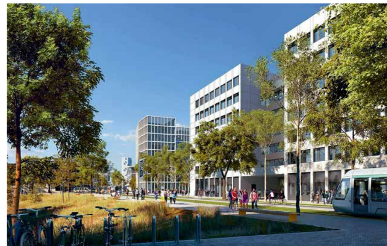
Sur la rue des Fillettes, au premier plan le bâtiment de recherche de l'îlot 3, suivi du siège de l'INED.

Après une année 2014 principalement consacrée au dialogue compétitif avec les groupements candidats, 2015 a vu se poursuivre le processus de validation par l'État et notamment le ministère chargé du budget, du cadre définitif du contrat de partenariat. Ce processus entamé fin 2014 s'est conclu par un arbitrage interministériel et l'annonce par le Premier Ministre le 14 avril 2015 de la poursuite du projet selon le programme initial. Le dossier de demande d'offres finales élaboré par l'Établissement public avec l'appui de ses assistants techniques, juridiques et financiers (respectivement Panerai et associés, Artelia, Dentons, Finance Consult) et de l'EPAURIF a immédiatement été envoyé aux quatre candidats encore en lice. Trois d'entre eux ont remis une offre finale le 17 septembre 2015. Les offres ont fait l'objet d'un examen attentif au cours du dernier trimestre de l'année 2015. Cette analyse a mobilisé toutes les forces disponibles au sein de l'Établissement public Campus