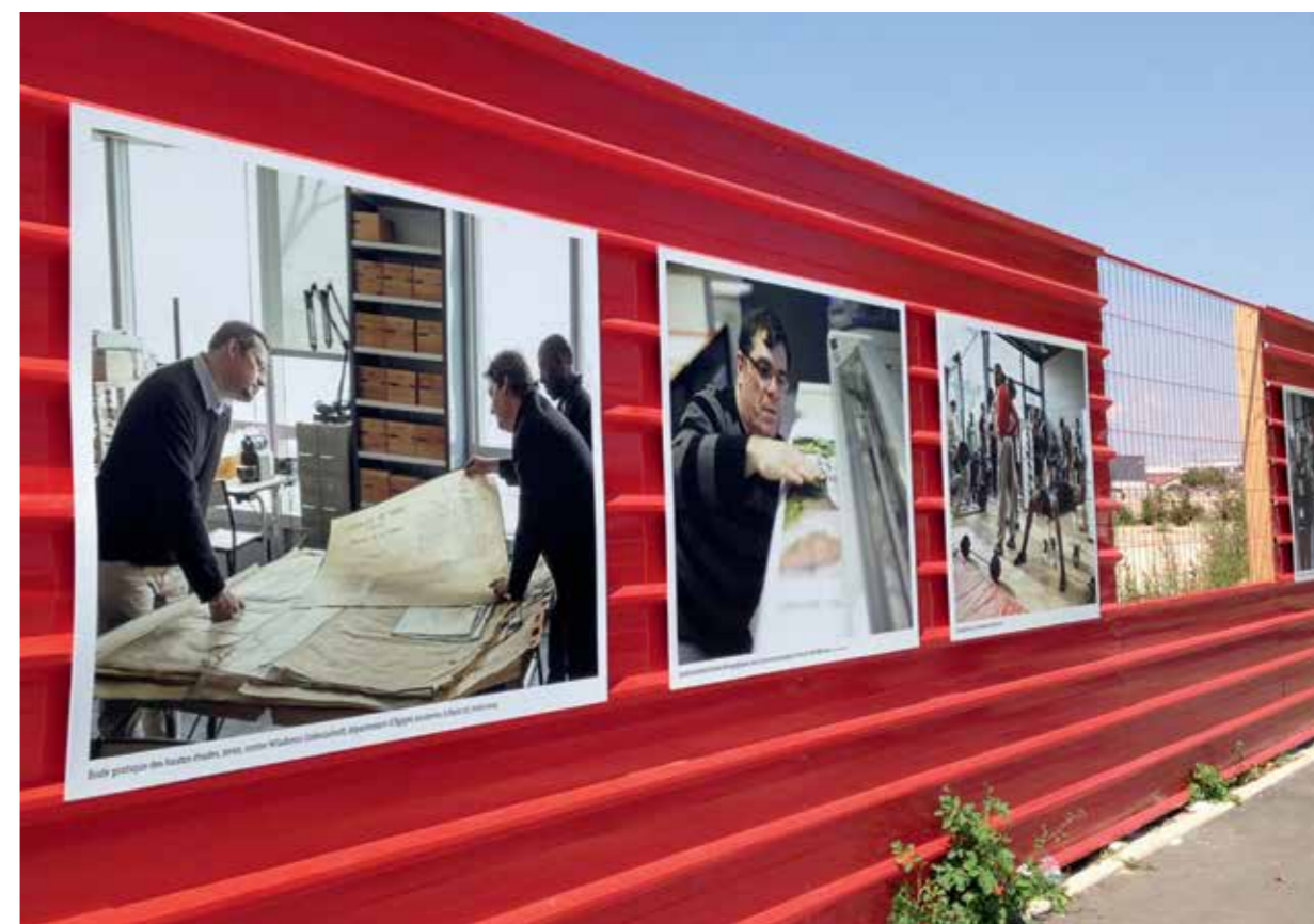
« Les membres fondateurs du Campus Condorcet ». Exposition sur les palissades du Campus le long de la rue Waldeck-Rochet à Aubervilliers.