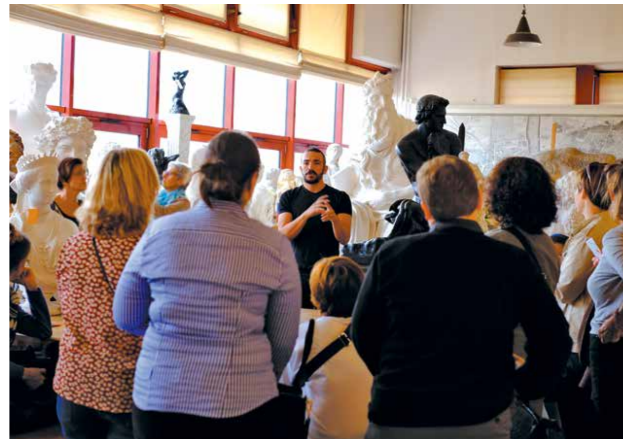
Visite de la Réunion des Musées Nationaux dans le cadre de la Promenade urbaine de juin 2015.

Adressée à plus de 1 000 contacts par voie électronique, la lettre du Campus informe ses lecteurs sur l'avancement du projet et sur les activités de coopération scientifique et de diffusion des savoirs promues par l'Établissement public. Chaque édition est consultée en moyenne par 4 000 personnes, grâce notamment à sa rediffusion sur les réseaux internes de plusieurs membres fondateurs. En fin d'année, sa parution est devenue bimestrielle et une réflexion a été lancée pour optimiser son arborescence, son contenu éditorial et son graphisme.