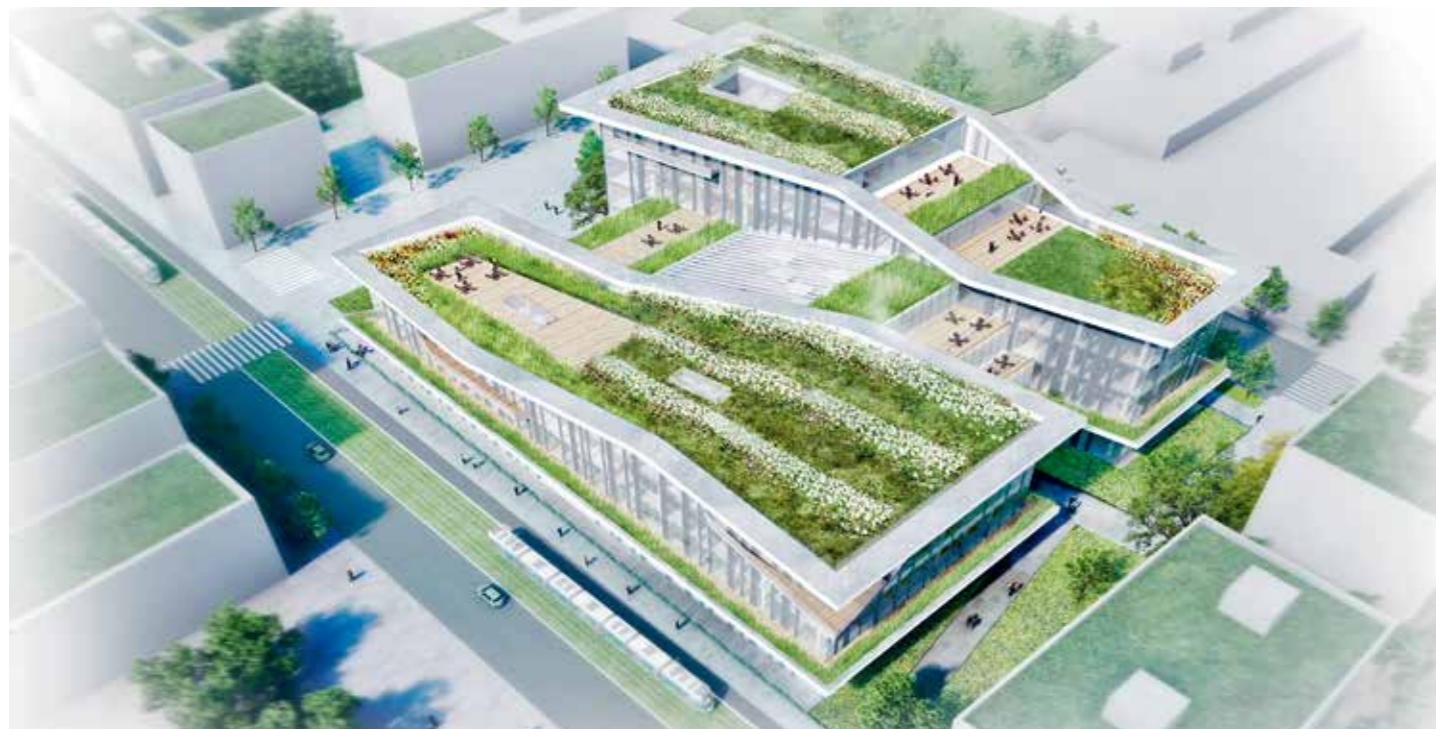
Perspective aérienne de la Bibliothèque. © Elisabeth de Porzamparc, Conseil régional Île de France 2014